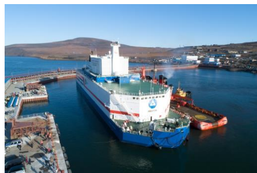
Рис. 1. Общий вид ПАТЭС с РУ КЛТ-40С

Плавучая атомная теплоэлектростанция (ПАТЭС) в г. Певеке (рис. 1) является уникальным инженерным сооружением, не имеющее аналогов в мировой практике. Являясь самой северной точкой атомной генерации, станция представляет собой интегрированный комплекс, состоящий из плавучего энергоблока «Академик Ломоносов» с двумя реакторными установками типа КЛТ-40С и береговой распределительной инфраструктуры. Номинальная мощность установки составляет 70 МВт по электроэнергии и 50 Гкал/ч по тепловой энергии, что обеспечивает стабильное энергоснабжение в экстремальных климатических условиях.