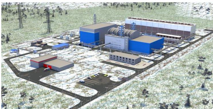
Рис. 3. Проект АЭС ММ с РУ РИТМ-200 [6]

Концепция АСММ характеризуется модульностью компоновки, компактными габаритами, сокращенными сроками строительства, а также соответствием высоким стандартам безопасности (рис. 3).